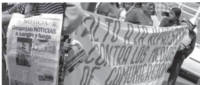
Manifestantes protestan en las calles de Oaxaca por la ocupación violenta del Diario Noticias.